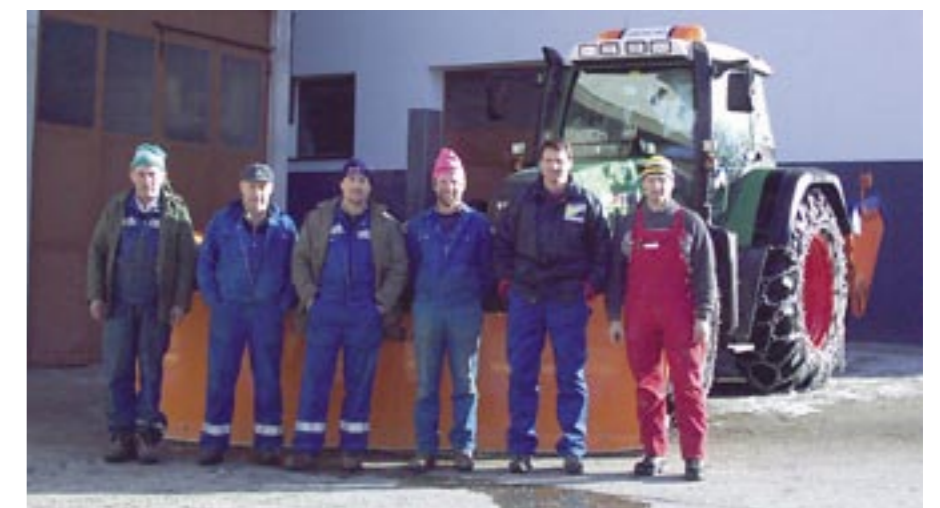
Voller Einsatz für schneefreie Straßen - Der Bauhof wünscht allen Lesern frohe und gesegnete Weihnachten und einen guten Rutsch ins neue Jahr

(lt. Vermessung Amt der Tiroler Landesregierung); Die Vermessungen sind nun abgeschlossen, um das Projekt weiterführen zu können, musste der Gemeinderat einen formellen Beschluss fassen, dass die vorgesehenen Flächen ins öffentliche Gut übergehen.