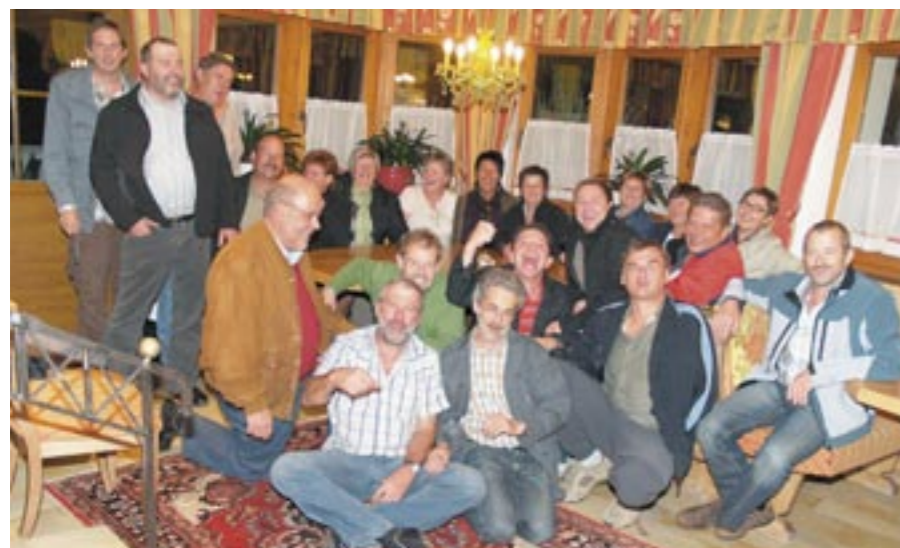
Gruppenfoto der Teilnehmer