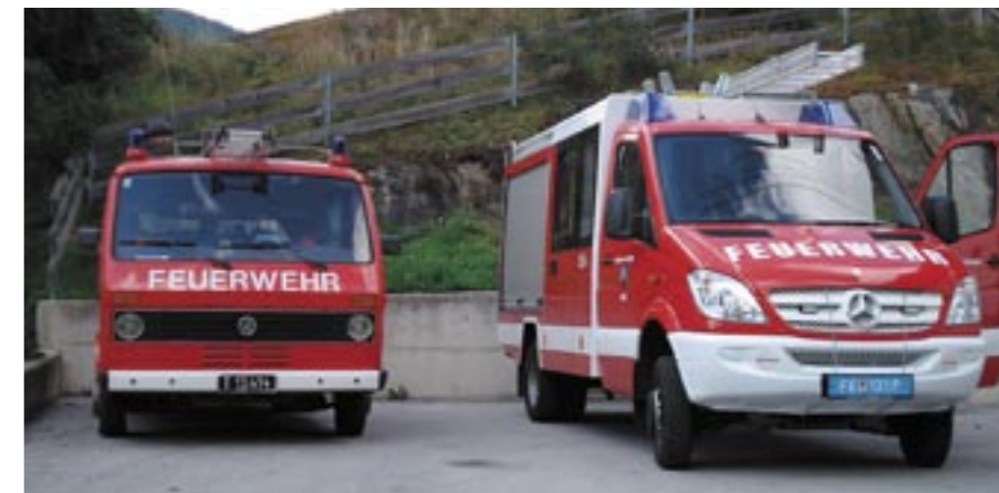
Das alte und neue Einsatzfahrzeug der Feuerwehr Leins

Am 19.9. konnten wir das neue Auto abholen