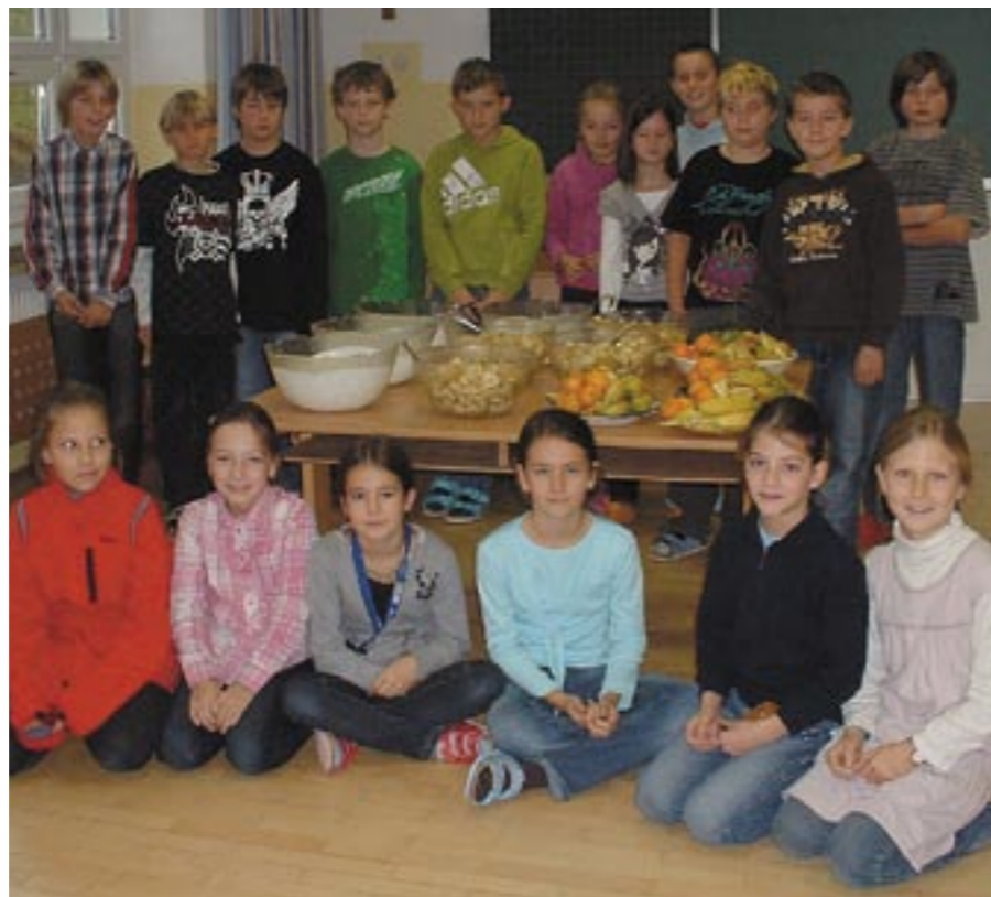
Kinder der Volksschule Arzl mit der leckeren Jause

Wir alle wollen, dass unsere Kinder sich (halbwegs) gesund ernähren und ausreichend bewegen. Die Volksschule Arzl hat diesen Gedanken aufgegriffen, und 2 Projekte gestartet.