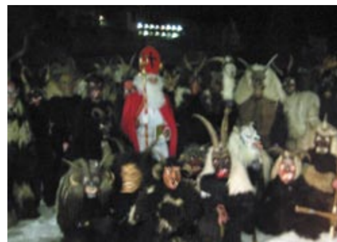
Die dunklen Gesellen mit dem heiligen Nikolaus