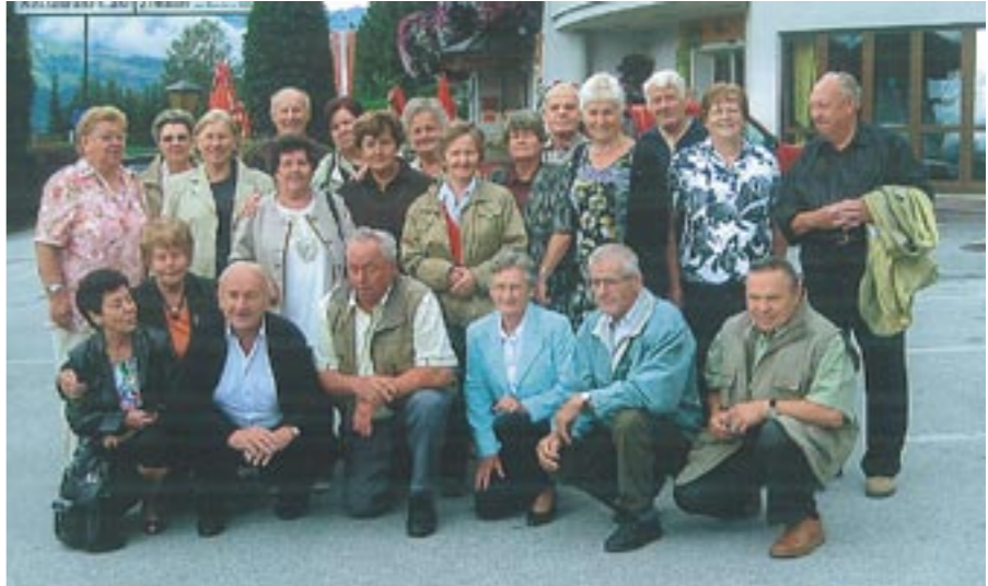
Gruppenbild der Jahrgänger 1938 mit Partner

Zum 70er trafen sich die Jahrgänger mit Partnern bereits zum fünften Mal. Vom 23. bis 24. August wurde vom Komitee ein Ausflug organisiert.