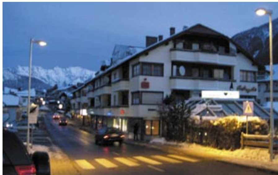
Die Straßenbeleuchtung der Zebrastreifen im Ortsgebiet Arzl wurde erneuert

ta (betrifft Wasserversorgungsanlage Arzl) ; Der Hochbehälter in Arzl soll an den Stand der Technik angepasst und im Zuge der momentan erstellten neuen Leitung vom Hochbehälter auf Nirosta umgestellt werden. Vom Wasserausschuss wurde das Projekt schon befürwortet. Dem Gemeinderat liegen zwei Angebote vor, der Billigstbieter (Firma Grutsch) erhielt den Zuschlag.