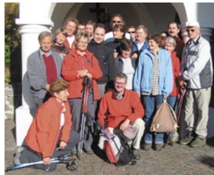
Wallfahrt der Leiner Feuerwehrler

gemeinsam die heilige Messe. Es war ein schöner besinnlicher Sonntag und die FF Leins wird diese Wallfahrt auch nächstes Jahr wieder organisieren. Wir freuen uns jetzt schon auf zahlreiche Teilnahme. (Andreas Huter, FF-Leins)