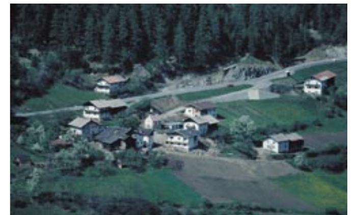
Anfang der 80iger Jahre wurde die neue Einfahrt errichtet