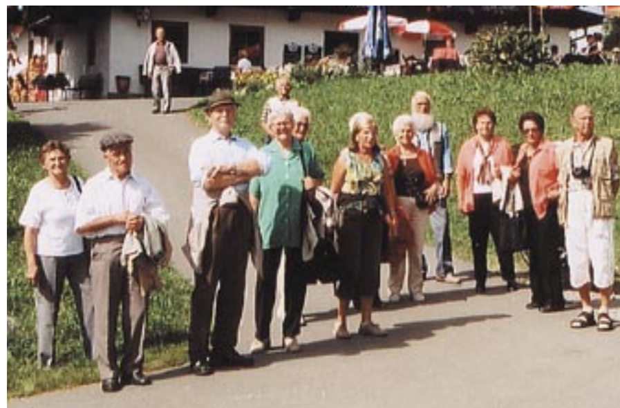
Einkehr beim Hintersteiner-See