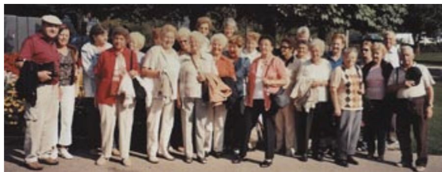
Arzler Seniorengruppe auf Reisen