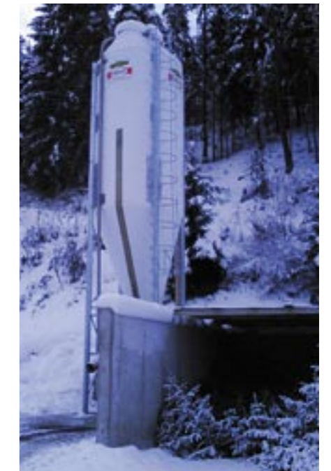
Um den Winterdienst besser bewältigen zu können, wurde beim Recyclinghof ein Salzsilo aufgestellt

Einstimmiger Beschluss: Flurbereinigung Hochasten – Übernahme der vorgesehenen Flächen ins öffentliche Gut