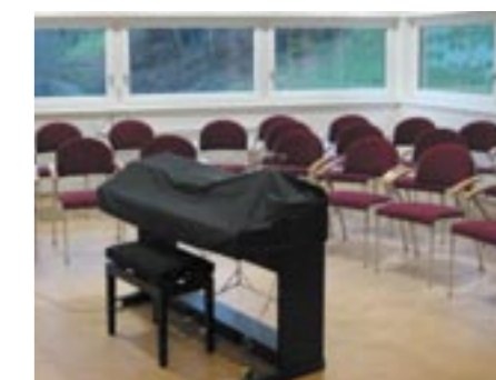
Proberaum der Sängerrunde Arzl