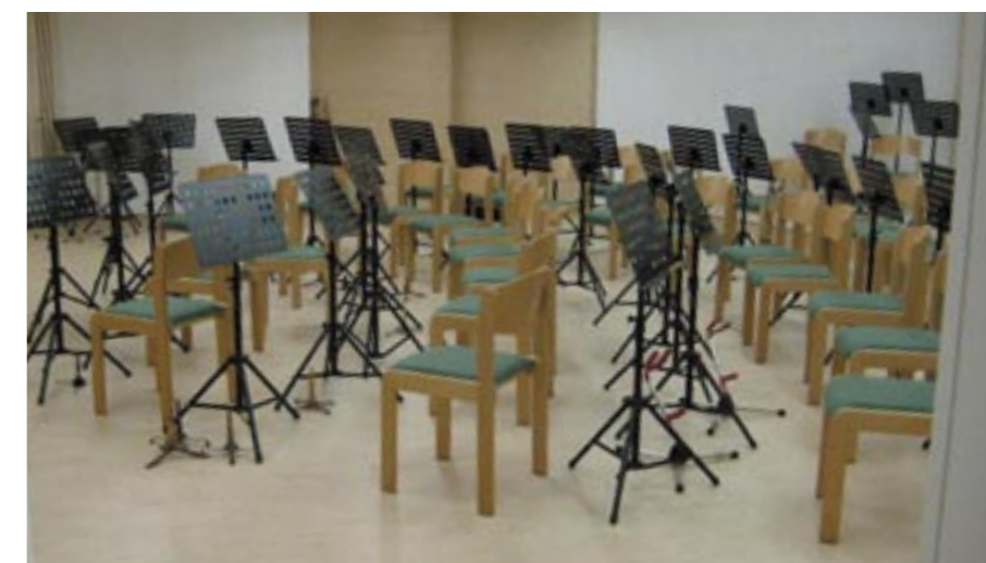
Probelokal der Musikkapelle Arzl