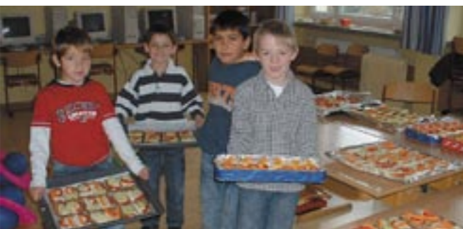
Stolz präsentieren die Kinder die Köstlichkeiten

Das Redaktionsteam der Gemeindezeitung versucht immer das neueste und wichtigste in der aktuellen Ausgabe zu berücksichtigen. Leider ist es uns jedoch nicht möglich, dass wir alle Informationen, Auszeichnungen und Ehrungen unserer teilweise sehr aktiven, erfolgreichen und fleißigen Gemeindebürger selbst herausfinden können. Wir bitten deshalb alle Gemeindebürger uns Informationen weiterzuleiten, vor allem möchten wir auch an die Vereine herantreten und diese bitten uns Erfolge, Ehrungen oder Auszeichnungen von Mitgliedern mitzuteilen.