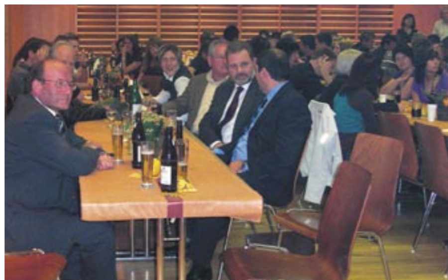
Gute Stimmung bei der diesjährigen Jungbürgereifer