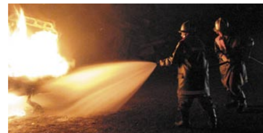
Feuerwehrmänner beim löschen