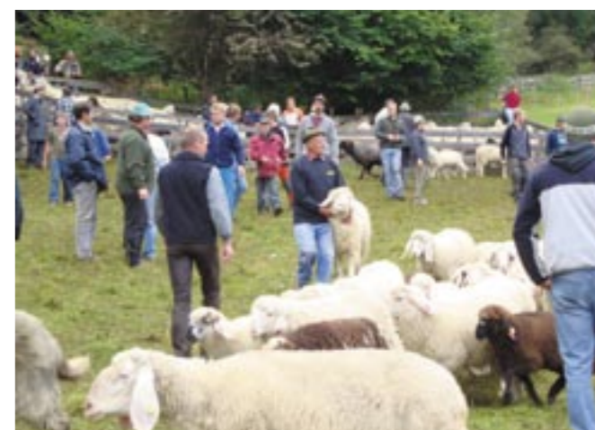
Schafbauern im vollem Einsatz