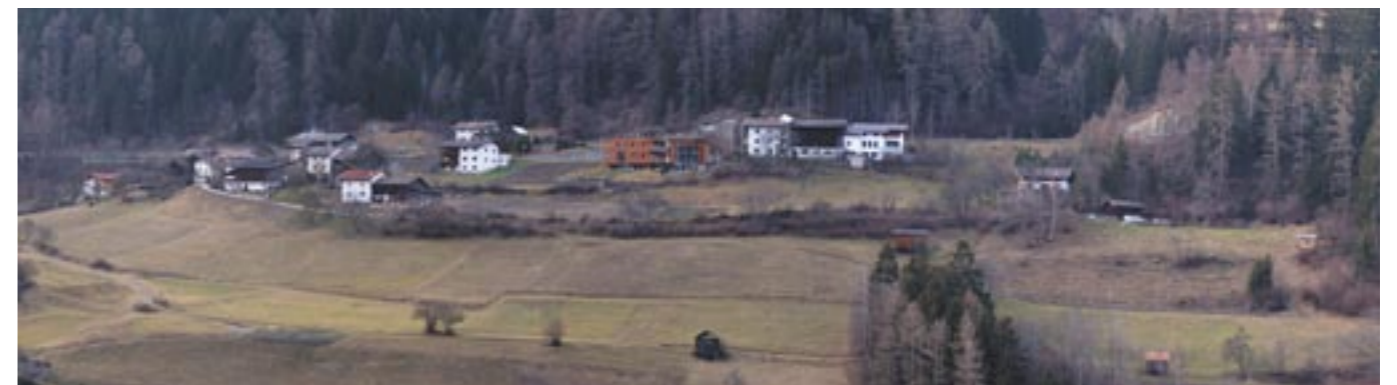
Unten eine Aufnahme von Blons vom Jänner 2007