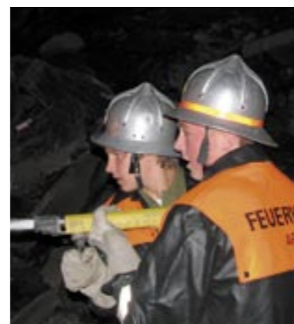
Junge Feuerwehrmänner beim löschen

wähnen, dass der ganze Ablauf und die Zusammenarbeit der Einsatzkräfte sehr gut funktioniert haben, alle Übungen gut durchgeführt wurden und es keinerlei Verletzungen gab.