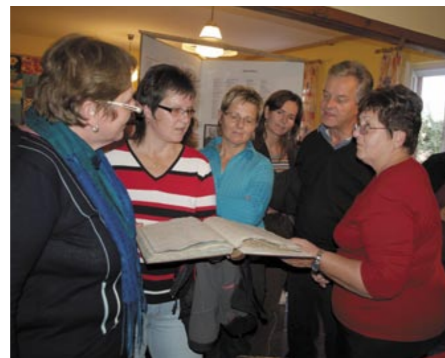
Reges Interesse an der Ausstellung zeigten die zahlreichen Besucher