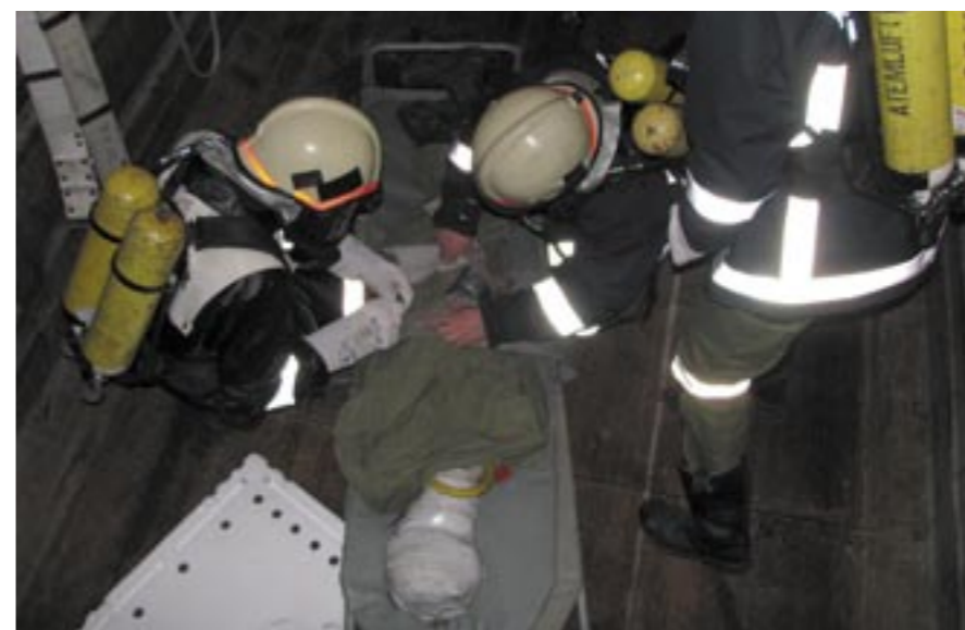
Bergung eines Verletzten mit schwerem Atemschutz

Vom 07. bis 08.02.2009 findet das diesjährige Hallenturnier des SV-Arzl statt