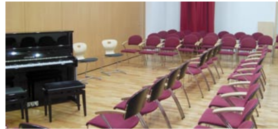
Vortragsaal MZG Arzl