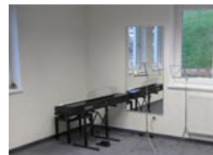
Proberaum der Landesmusikschule Pitztal

Die Einweihung des Mehrzweckgebäudes und der Außenanlage ist mit 17. Mai 2009 geplant.