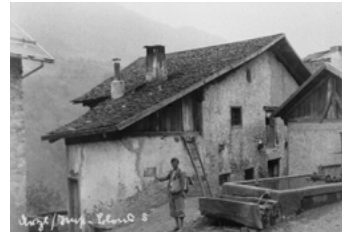
Doppelhaus der Familie Gastl + Hackl (Haus-Nr: 4+5)