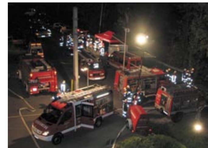
Bahnhof von der Drehleiter Imst aus