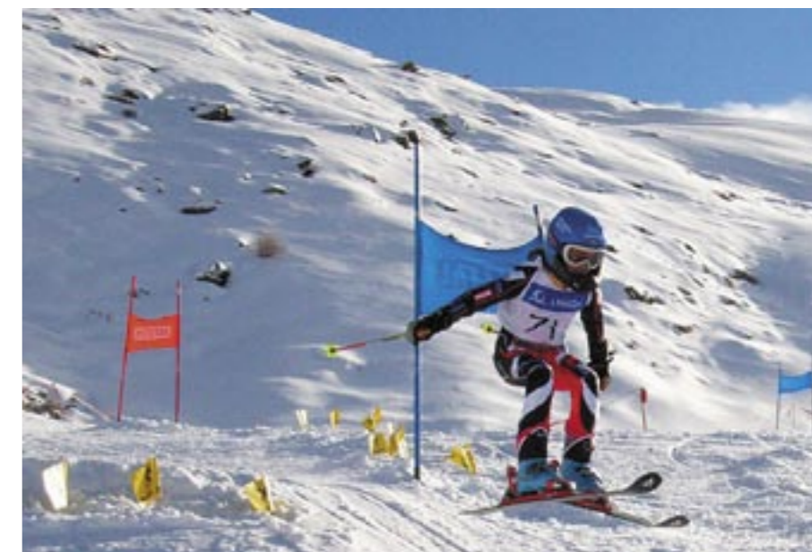
Super Verhältnisse beim PitzRace 2007