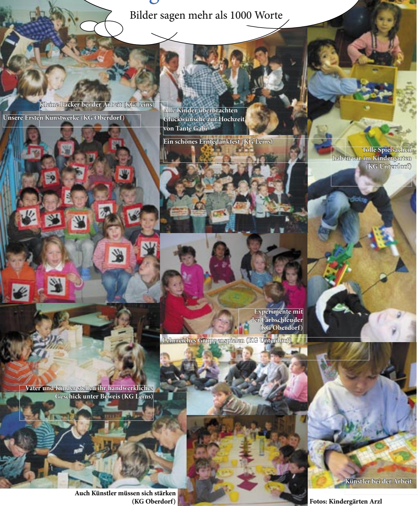
Kleine Bäcker bei der Arbeit (KG Leins)