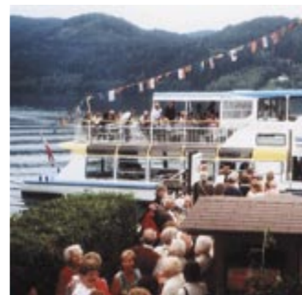
Schiffahrt am Millstättersee

Unser Ziel war Bad Kleinkirchheim. Die Reise führte über den Felbertauern nach Lienz, dort machten wir eine Mittagsrast und sahen uns die Stadt an. Anschließend fuhren wir durchs obere Drauntal nach Spittal weiters nach Millstatt und Radentheim. Untergebracht waren wir im Hotel Almrausch, welches über tolle Zimmer verfügt und vorzügliche Speisen kredenzte. Am zweiten Tag wanderten einige von uns in der Almregion, besuchten dort die Erlacherhütte und die St. Oswaldhütte. Die zweite Gruppen genoss eine Schiffsrundfahrt auf dem Ossiachersee. Am dritten Tag machten wir einen Ausflug über die Nockalm-Panoramastraße (Eben Reichenau nach Krems-Brücke). In Gmünd machten wir Mittagpause. Gestärkt führte uns unsere Fahrt weiter