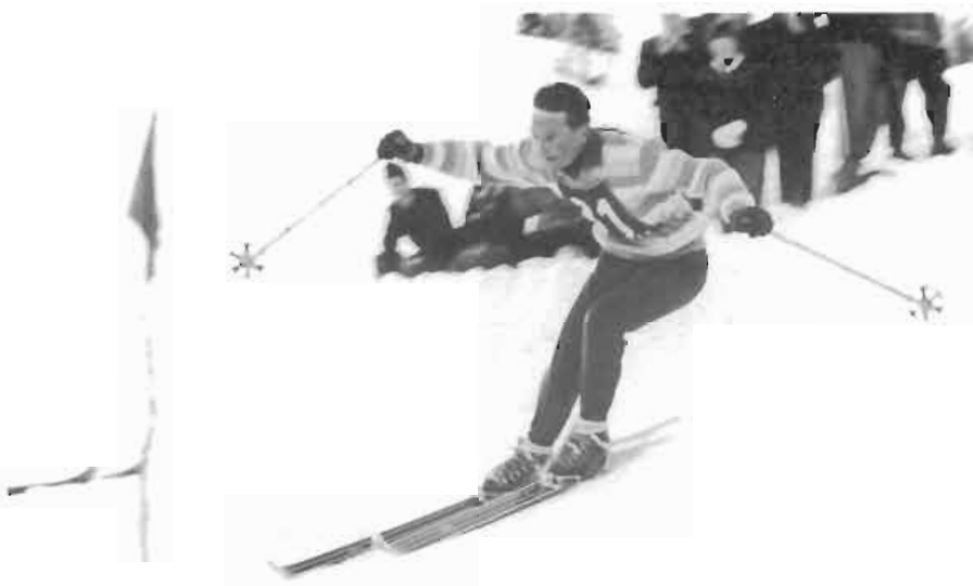
Vollen Körpereinsatz verlangten die Skirennen der Sektion Skisport.