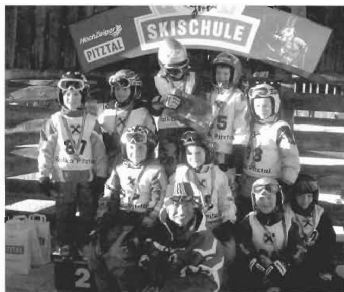
51 Kinder nahmen am Skikurs teil, der am Hochzeiger stattfand. Initiiert wurde der Kurs vom Elternverein Arzl.