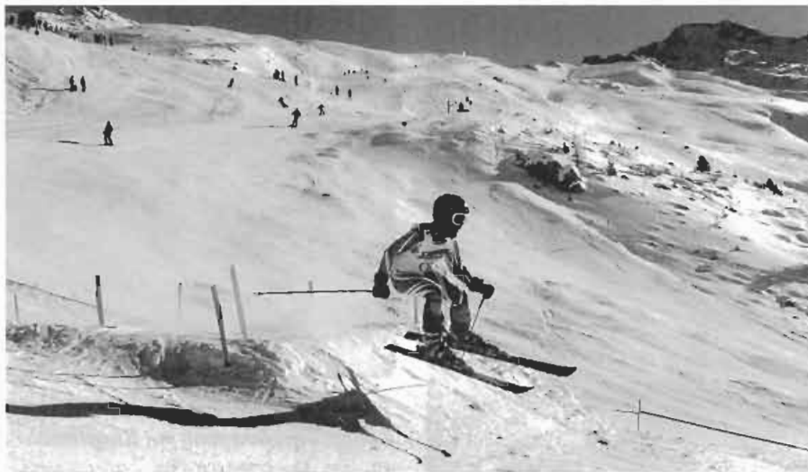
Das internationale Pitzrace hat der SC Wald zum ersten Mal veranstaltet.

Zum zweiten Mal fand am 12. Februar das Vergleichsrennen der Sportclubs aus Arzl, Wald und Leins statt. Die besten Läufer dieser Vereine kämpften für ihren Verein um den Titel der Schnellsten in der Gemeinde. Als Sieger gingen nach zahl-