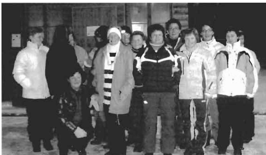
Die Stockerplätze gingen an die Gruppe „50+“, die sich den Dorfmeistertitel holten, an die Gruppe „Hausfrauen“ und an die Gruppe „Wienrunde“.