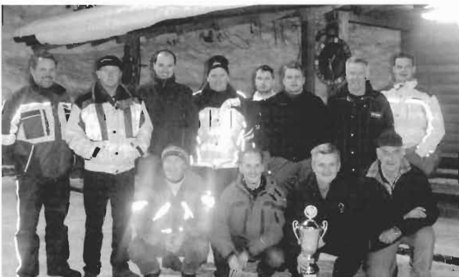
Bei den Herren sicherte sich die Gruppe „Kniezwallner“ den ersten Platz, gefolgt von der Gruppe „Gemeinde“ und der Gruppe „Feuerwehr II“.