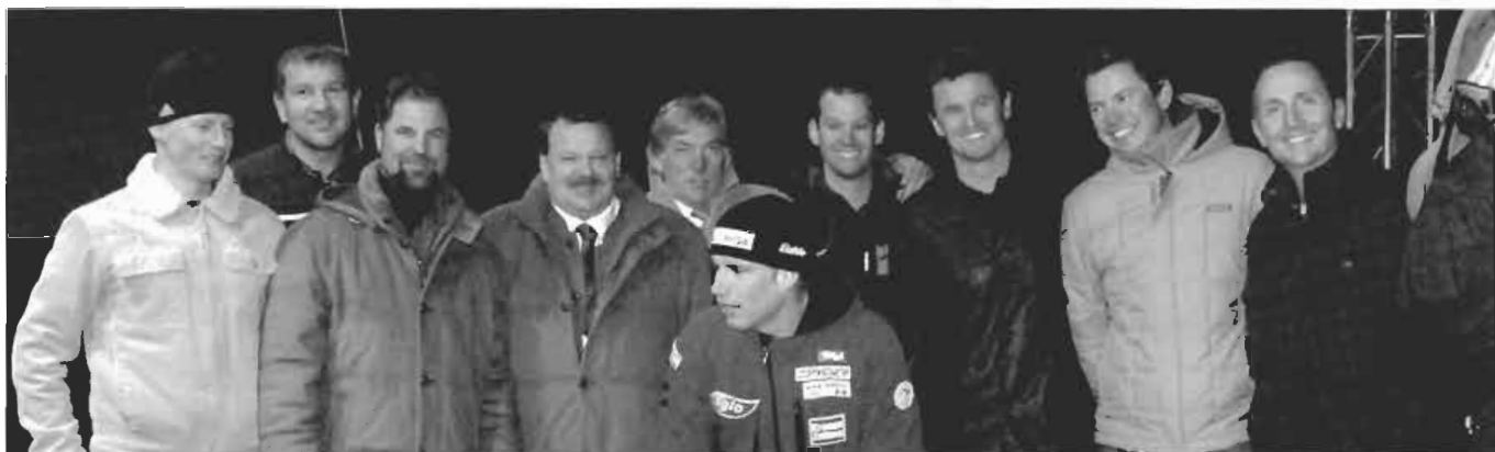
Benni Raich im Kreise seiner Trainer, Helfer und Freunde, die er bei der Ehrung besonders hervorhob.