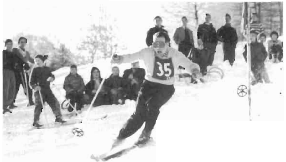
Dieser Teilnehmer des Skirennens hatte sichtlich Spaß beim Skifahren.