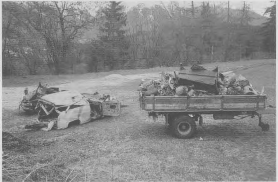
Ein Bild sagt mehr als tausend Worte...

In diesem Zusammenhang bitten die Verantwortlichen die ganze Bevölkerung, mit dem Müll nicht so sorglos umzugehen.